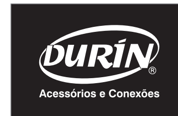
Versão prata Escala Pantone Prata 877